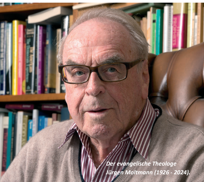
Der evangelische Theologe Jürgen Moltmann (1926 - 2024).

Als Jürgen Moltmann 1975 Korea besucht, gerät er mitten in die Auseinandersetzungen zwischen der „unerhörten missionarischen Lebendigkeit der Christen auf der einen Seite und auf der anderen Seite die sich entwickelnde Diktatur des Staatspräsidenten Park, der demokratische Rechte und Pflichten unterdrückt“. Der südkoreanische Geheimdienst