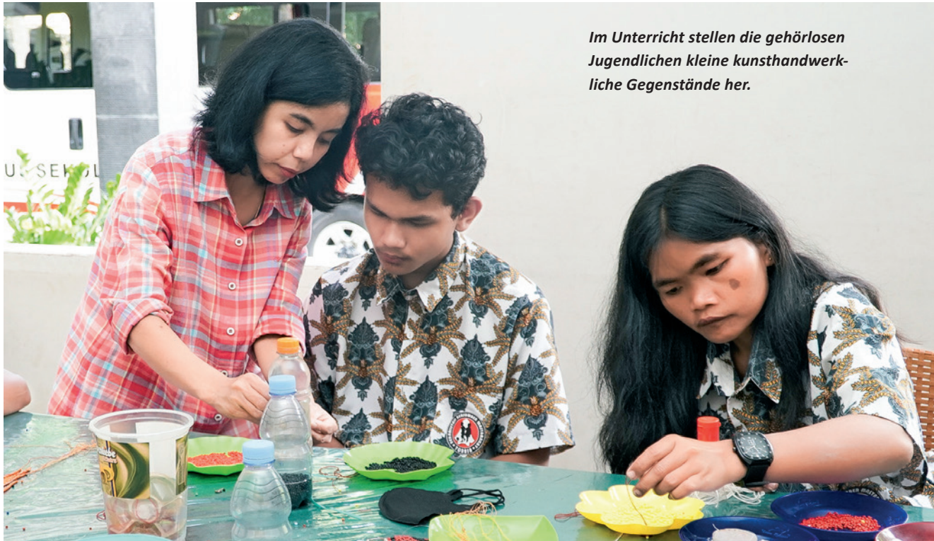
Im Unterricht stellen die gehörlosen Jugendlichen kleine kunsthandwerkliche Gegenstände her.